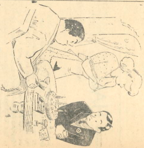
De spreker. Deze ging door.